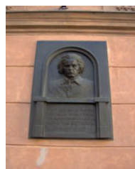
Pamětní deska v Praze