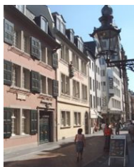
Rodný dům v Bonnu